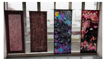
シルクスクリーンで染めた作品