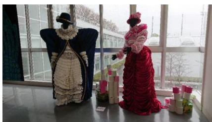
トイレットペーパーで作られたドレス