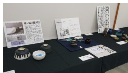
「モノクロお茶碗」など