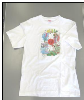
実際に贈呈されたTシャツ